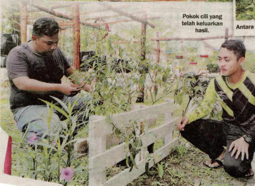
Pokok cili yang telah dikeluarkan hasil.