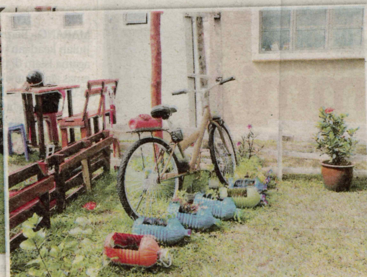
Antara hiasan menarik di kebun dalam kampus itu.