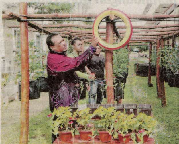
Tayar terbuang turut digunakan sebagai hiasan.

"Kita membuka kebun ini kepada sesiapa sahaja untuk datang dan melihat dengan lebih dekat, manakala penjagaan pula dibuat secara bergilir-gilir oleh kumpulan kami," katanya kepada Sinar Harian ketika ditemui di sini, semalam.