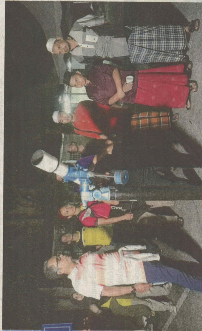
Pengunjung tidak lepaskan peluang melihat gerhana bulan dengan menggunakan teleskop yang disediakan.

Fenomena sama yang hanya akan berulang dalam tempoh 123 tahun lagi itu bermula pada jam 1.14 pagi dan gerhana bulan penuh