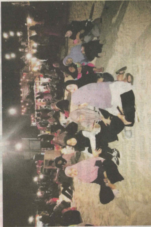
Orang ramai memenuhi kawasan pantai Tok Jembal.

Dapo Pata, Tok Jembal, di sini, malam tadi.