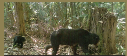
Sun bear ( Helarctos malayanus )