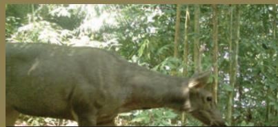
Sambar deer ( Rusa unicolor )