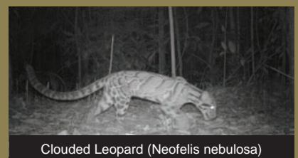
Clouded Leopard ( Neofelis nebulosa )