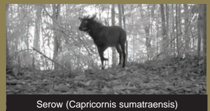
Serow ( Capricornis sumatraensis )