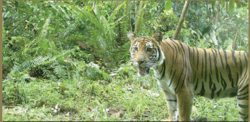
Malayan Tiger ( Panthera tigris )