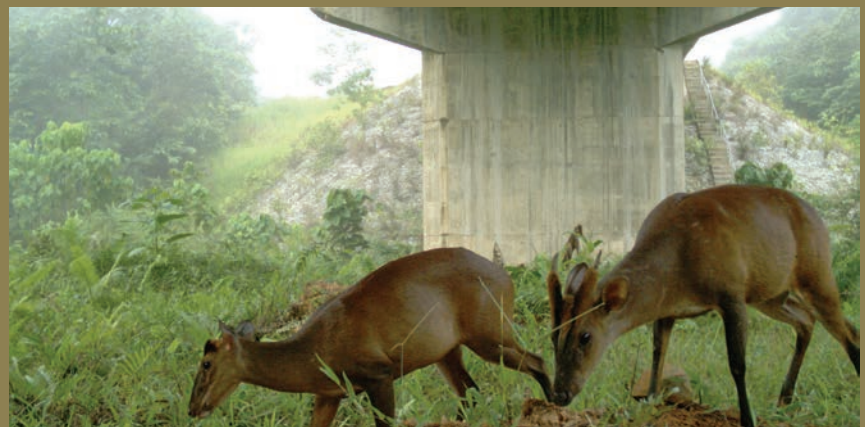
Barking deer ( Muntiacus muntjak )