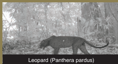
Leopard ( Panthera pardus )