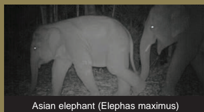
Asian elephant ( Elephas maximus )