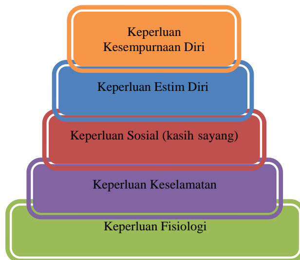
Rajah 1.2: Hierarki Keperluan Manusia, Maslow