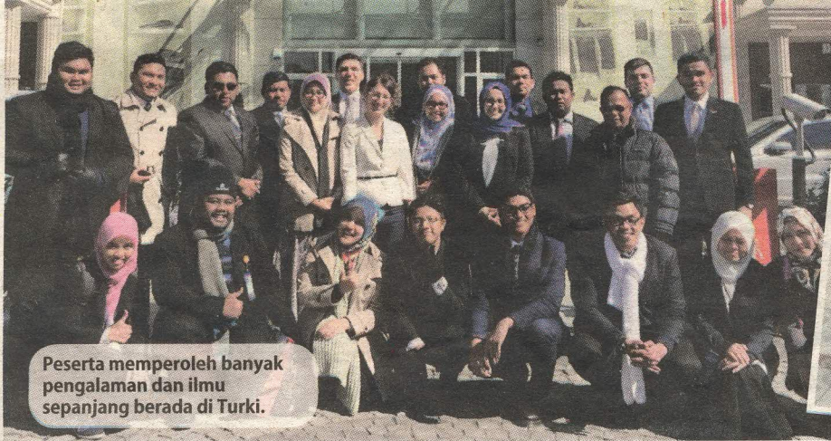
Peserta memperoleh banyak pengalaman dan ilmu sepanjang berada di Turki.